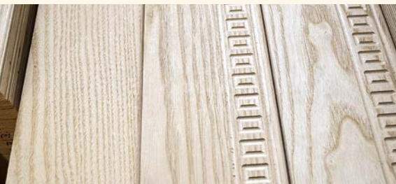
Текстура неокрашенных деталей стола