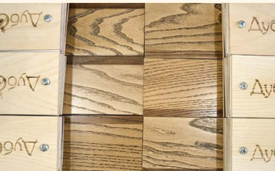
Приёмом патинирования можно подчеркнуть текстурный рисунок.